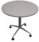
Mahai borobila (05) Base metalikoa eta grisa. 0,80 ø x 0,70 mh Prezioa: 75€