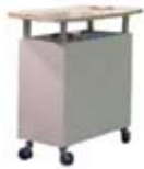
Tapa kurbadun mostradorea (08) Gurpilduna, tapa kurbaduna eta barruan apalarekin Prezioa: 175€ inpresioarekin +30€