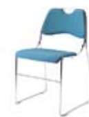
Ainara aulkia (01) Urdin-grisean tapizaturiko aulki herdoilgaitza Prezioa: 35€

Katalogoan aukeratu nahi dituzun altzariak: