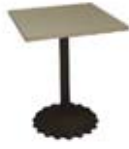
Mahai laukizuzena (06) Base metalikoa eta kolore zuria. 0,60 x 0,60 x 0,70 mh Prezioa: 80€